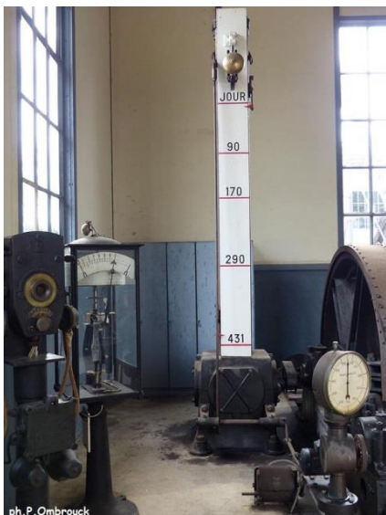
Appareillage de contrôle