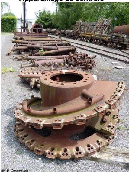
Fraise de haveuse d'abattage