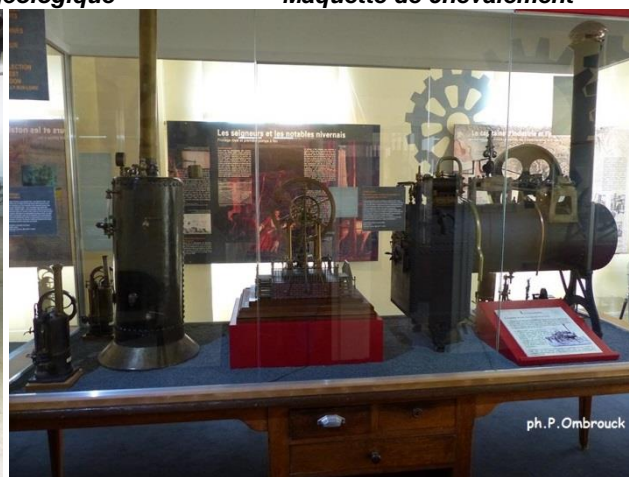
Dessus et dessous : maquettes de chaudières et lavoir