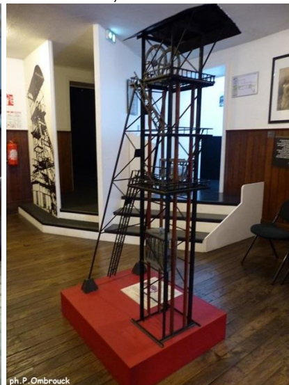
Maquette de chevalement