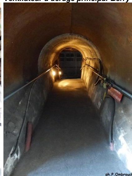
Autre galerie de communication