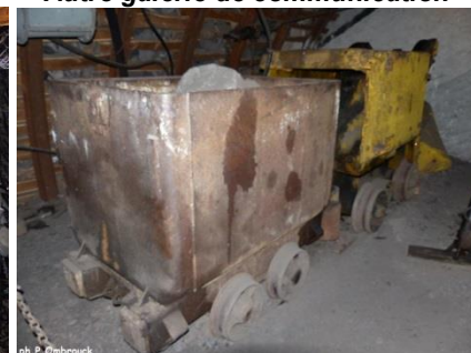
Berline et chargeuse Eimco

La Machine a compté une dizaine de puits, soit : des Glénons, de la Chapelle, des Coupes, Marie, des Zagots, de la Haute Meule, Pré Charpin, Marguerite, Henri Paul, des Minimes (ex-Schneider). La profondeur maximale atteinte serait d'environ 700 m mais je n'ai pas le nom du puits concerné. Puits des Glénons : foncé de 1825 à 1827, il est muni d'un chevalement en bois - est porté ensuite à 431 m de profondeur - en 1953 il reçoit celui en métal de 25 m amené du Bois de Verne (Blanzay) Il stoppe son extraction en 1954 et assure l'aérage et le secours du puits d'extraction des Minimes. Puits des Zagots : foncé vers 1840, son carreau utilisait déjà un culbuteur - arrêt d'activité en 1961. Puits Marguerite : le 18.02.1890, un coup de poussier fait 43 morts - son extraction cesse en 1927. Puits Henri Paul : réalise l'extraction jusqu'en 1961, puis sert à l'aérage et à la descente du matériel. Puits Schneider (des Minimes en 1909) : foncé début 1900, concentre l'extraction à partir de 1961. Le puits des Télots (1824 - 1957) produisait des schistes bitumineux pour faire des hydrocarbures.