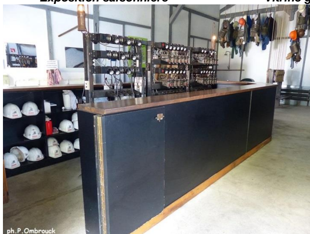
Accueil avec casques, lampisterie et recharge