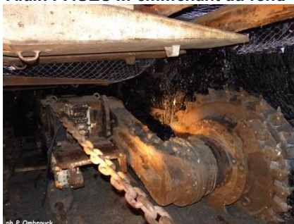
Haveuse en situation de travail