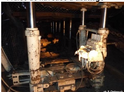
Piles de soutènement marchant