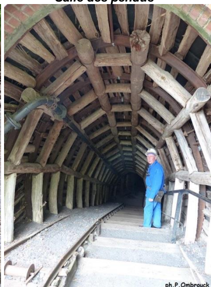
Alain PAGES m'emmenant au fond