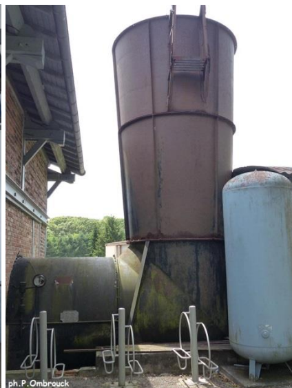
Ventilateur d'aérage principal Berry