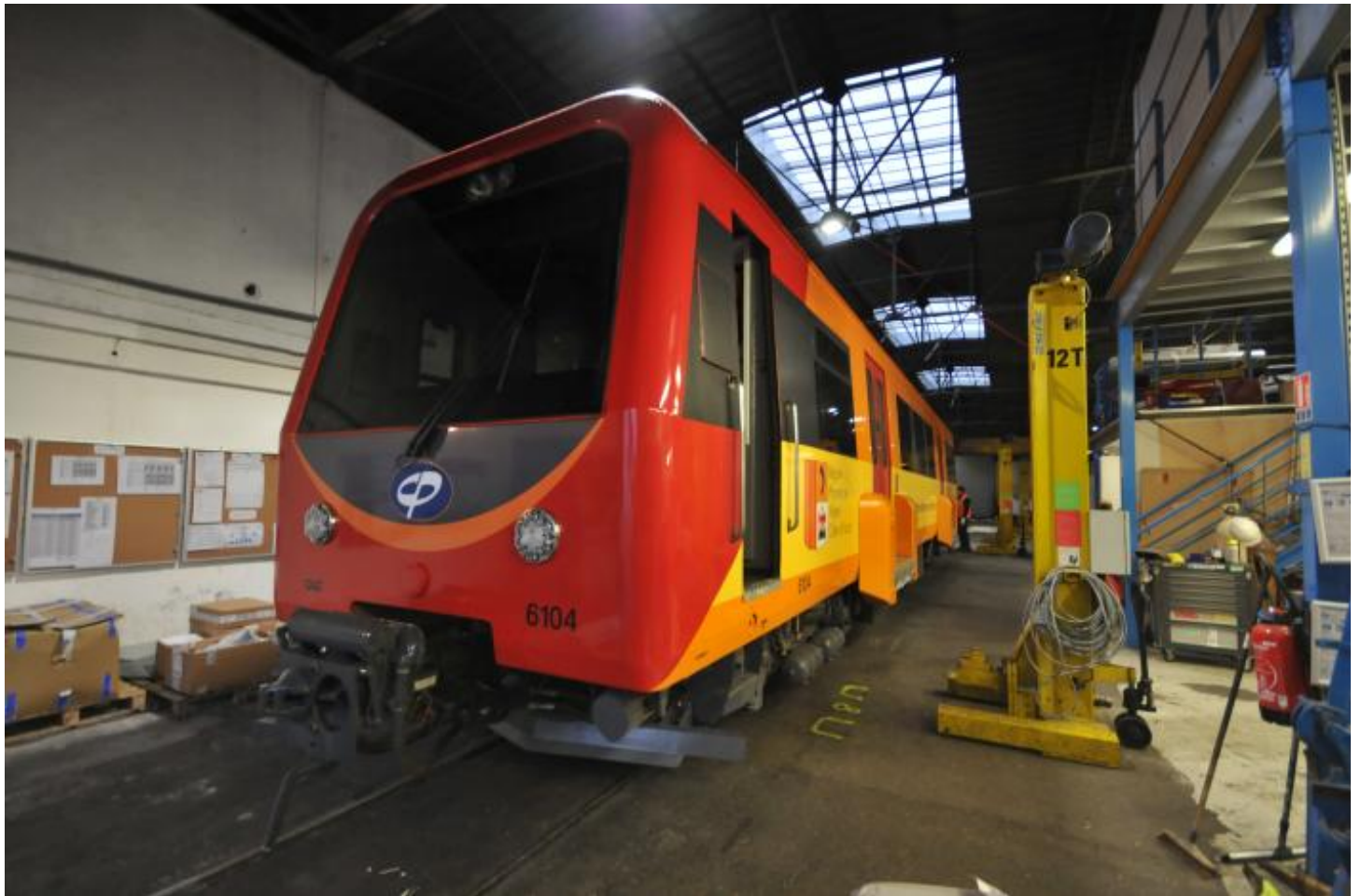
La demi-rame CAF n° 6104 est arrivée le 4 avril aux ateliers de Lingostière en provenance de l'entreprise Arterail à Lille.