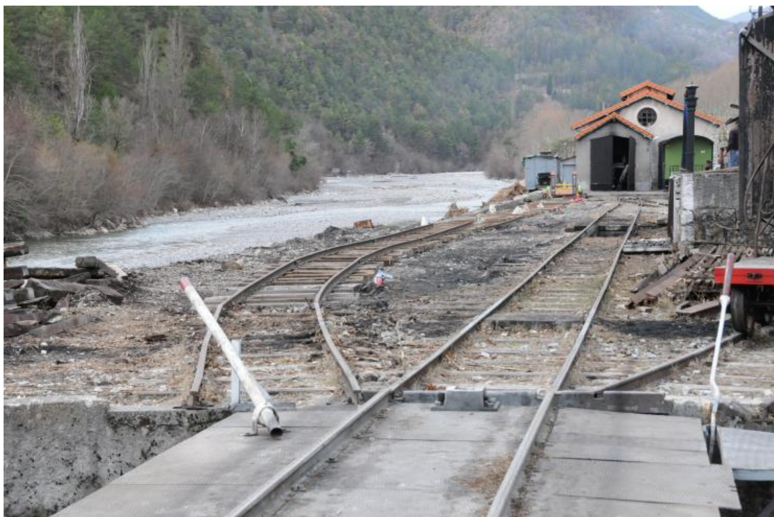
La nouvelle voie 9 a été posée au départ du pont tournant, à l'emplacement des pins abattus le long du Var.