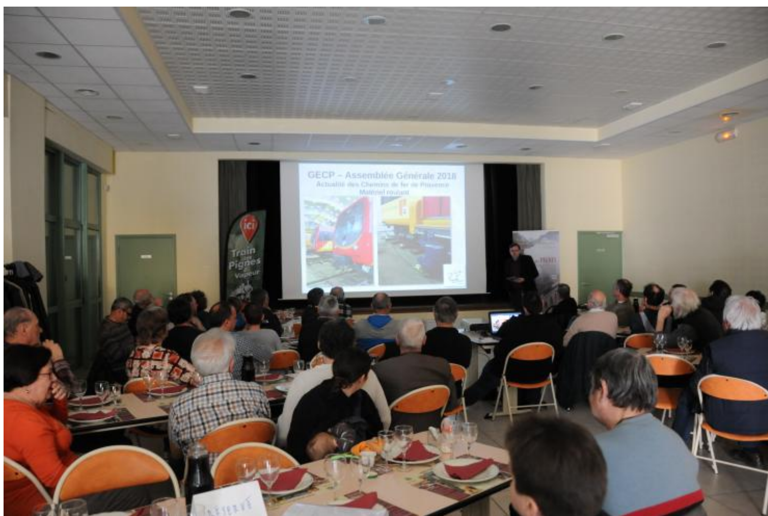
L'assemblée générale du GECP s'est déroulée le dimanche 25 mars à Entrevaux. 53 adhérents venus de toute la France ont partagé ce moment convivial.