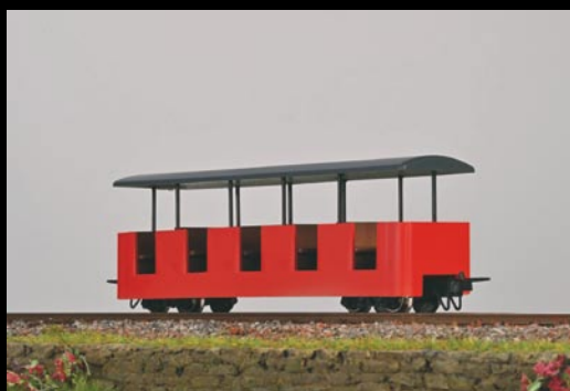
5196 Wagen rot Coach red