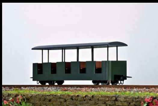
5195 Wagen grün Coach green